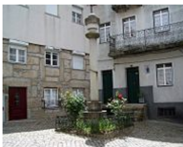
Largo do Pelourinho

Loriga é uma vila industrial (têxtil) desde a primeira metade do século XIX , em termos de indústria moderna, sendo também influenciada pela chamada revolução industrial. No entanto, já no século XV os loriguenses se dedicavam aos lanifícios, embora de forma artesanal. Chegou a ser uma das localidades mais industrializadas da Beira Interior , e a actual sede de concelho só conseguiu suplantá-la quase em meados do século XX . Tempos houve em que só a Covilhã ultrapassava Loriga no número de empresas. Nomes de empresas, tais como: Regato, Redondinha, Fonte dos Amores, Tapadas, Fândega, Leitão & Irmãos, Augusto Luis Mendes, Lamas, Nunes Brito, Moura Cabral, Lorimalhas, etc, fazem parte da rica história industrial desta vila. A principal e maior avenida de Loriga tem o nome de Augusto Luís Mendes, o mais destacado dos antigos industriais loriguenses. Apesar de, por exemplo, dos maus acessos que se resumiam à velhinha estrada romana de Lorica, com dois mil anos, o facto é que os loriguenses transformaram Loriga numa vila industrial progressiva, o que confirma o seu génio.