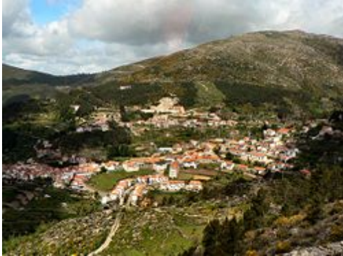
Vista geral de Loriga