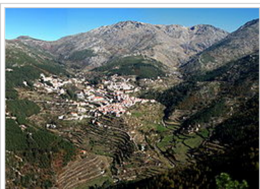
Vista panorâmica de Loriga e do vale glacial com o mesmo nome, semelhante a uma paisagem alpina

Loriga, situada na parte sudoeste da Serra da Estrela, encontra-se a 20 km de Seia, 80 km da Guarda e 320 km de Lisboa. A vila é acessível pela EN 231 e pela EN338, estrada concluída em 2006, seguindo um traçado e um projecto pré-existent há décadas, com um percurso de 9,2 km de paisagens de montanha, entre as cotas 960m (Portela do Arão ou Portela de Loriga) e 1650m, três quilómetros acima da Lagoa Comprida.