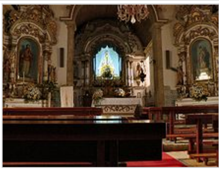
Igreja Matriz de Loriga - vista interior

O nome veio da localização estratégica da povoação, do seu protagonismo e dos seus habitantes nos montes Hermínios (actual Serra da Estrela) na resistência lusitana, o que levou os romanos a porem-lhe o nome de Loriga , designação geral para couraça guerreira romana; deste nome derivou Loriga (derivação iniciada pelos Visigodos), e que tem o mesmo significado. É um nome histórico, que pela sua antiguidade e significado justifica que a couraça seja a peça central do brasão da vila.