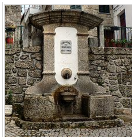
Fontanário em Loriga