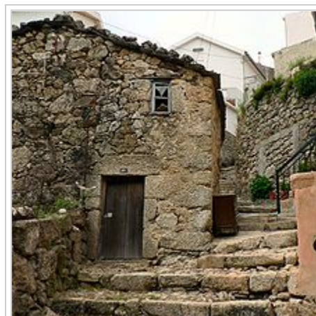
Rua da Oliveira

O bairro de São Ginês é um bairro do centro histórico de Loriga cujas características o tornam num dos bairros mais típicos da vila. As melhores festas de São João eram feitas aqui. Curioso é o facto de este bairro dever o nome a São Gens, um santo de origem céltica matirizado em Arles, na Gália, no tempo do imperador Diocleciano, orago de uma ermida visigótica situada na área. Com o passar dos séculos os loriguenses mudaram o nome do santo para S. Ginês, talvez por ser mais fácil de pronunciar, e mudaram o orago da sua ermida para Nossa Senhora do Carmo. Este núcleo da povoação, que já esteve separado do principal e mais antigo, situado mais abaixo, é anterior à chegada dos romanos.