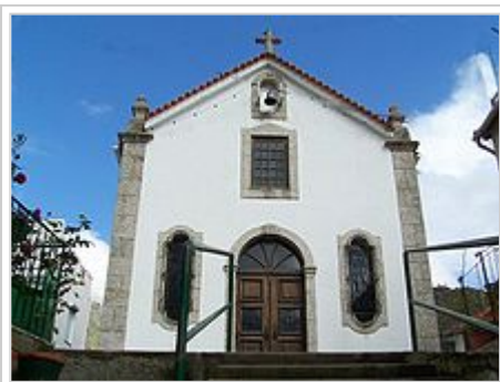
Capela de Nossa Senhora do Carmo

A estrada romana e uma das duas pontes (a outra ruiu no século XVI após uma grande cheia na Ribeira de S. Bento), com as quais os romanos ligaram Loriga, na Lusitânia, ao restante império, merecem destaque.