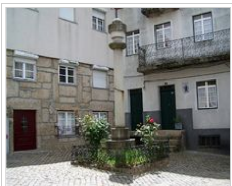
Largo do Pelourinho

Loriga tinha a categoria de sede de concelho desde o século XII, tendo recebido forais em 1136 (João Rhânia, senhorio das Terras de Loriga durante cerca de duas décadas, no reinado de D.Afonso Henriques), 1249 (D.Afonso III), 1474 (D.Afonso V) e 1514 (D.Manuel I). Apoiou os Absolutistas contra os Liberais na guerra civil portuguesa. Deixou de ser sede de concelho em 1855 após a aplicação do plano de ordenação territorial levada a cabo durante o século XIX, curiosamente o mesmo plano que deu origem aos Distritos. Porém, partir da segunda metade do século XIX, tornou-se um dos principais pólos industriais da Beira Interior, com a implantação da indústria dos lanifícios, que entrou em