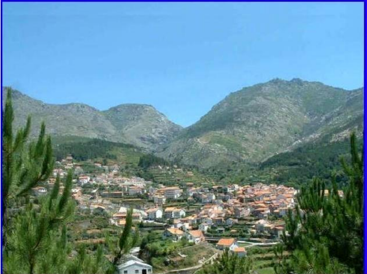
Centro histórico de Loriga, encimado pelos brasões da vila e de Portugal.