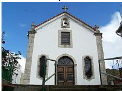
Capela de Nª Srª do Carmo

Em termos de património histórico, destacam-se também a ponte e a estrada romanas ( século I a.C. ), uma sepultura antropomórfica ( século VI a.C. ), a Igreja Matriz ( século XIII , reconstruída), o Pelourinho (século XIII, reconstruído), o Bairro de São Ginês (São Gens) com origem anterior à chegada dos romanos e a Rua de Viriato que a tradição local e diversos antigos documentos encontram origem nesta antiquíssima povoação. A Rua da Oliveira , pela sua peculiaridade, situada na área mais antiga do centro histórico da vila, recorda algumas das características urbanas da época medieval. A estrada romana e uma das duas pontes (a outra ruiu no século XVI após uma grande cheia na Ribeira de S. Bento), com as quais os romanos ligaram Lorica, na Lusitânia, ao restante império, merecem destaque.