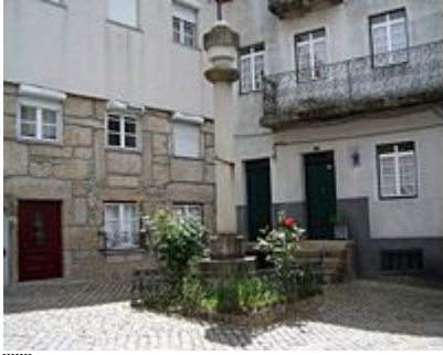
Largo do Pelourinho

anos, o facto é que os loricenses transformaram Loriga numa vila industrial progressiva, o que confirma o seu génio. Mas, Loriga acabou por ser derrotada por um inimigo político e administrativo, local e nacional, contra o qual teve que lutar desde o século XIX.