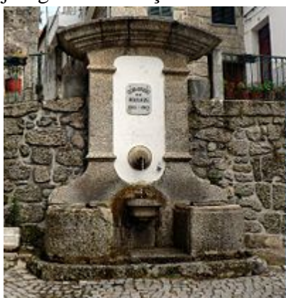
Fontanário em Loriga

O Bairro de São Ginês é um ex-libris de Loriga e nele destaca-se a capela de Nossa Senhora do Carmo, construída no local de uma antiga ermida visigótica precisamente dedicada àquele santo. Quando os romanos chegaram, a povoação estava dividida em dois núcleos. O maior, mais antigo e principal, situava-se na área onde hoje existem a Igreja Matriz e parte da Rua de Viriato e estava fortificado com muralhas e paliçada. No local do actual Bairro de S. Ginês existiam já algumas habitações encostadas ao promontório rochoso, em cima do qual os Visigodos construíram mais tarde uma ermida dedicada àquele santo.