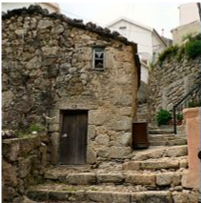
Rua da Oliveira

A rua da Oliveira é uma rua situada no centro histórico da vila. A sua escadaria tem cerca de 100 degraus em granito , o que lhe dá características peculiares. Esta rua recorda muitas das características urbanas medievais do centro histórico da vila de Loriga.