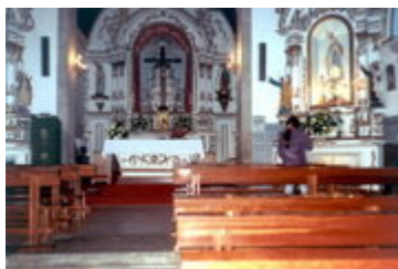
Igreja Matriz de Loriga - vista interior

O nome veio da localização estratégica da povoação, do seu protagonismo e dos seus habitantes nos Hermínios (actual Serra da Estrela) na resistência lusitana, o que levou os romanos a por-lhe o nome de Lorica (antiga couraça guerreira). Os Hermínios eram o coração e a maior fortaleza da Lusitânia. É um facto que os romanos lhe deram o nome de Lorica, e deste nome derivou Loriga (derivação iniciada pelos Visigodos ) e que tem o mesmo significado. É um caso raro, em Portugal, de um nome bi-milenar, e justifica que a couraça seja a peça central do brasão histórico de Loriga. É um nome muito antigo e de grande valor histórico para a vila.