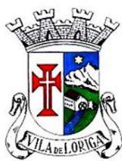
A NOVA HERÁLDICA