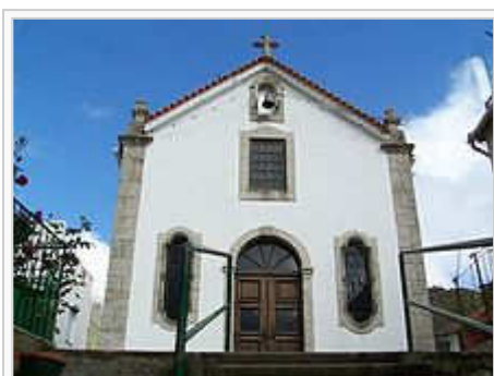
Capela de Nossa Senhora do Carmo

A estrada romana e uma das duas pontes (a outra ruiu no século XVI após uma grande cheia na Ribeira de S. Bento), com as quais os romanos ligaram Loriga, na Lusitânia, ao restante império, merecem destaque.