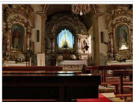
Igreja Matriz de Loriga - vista interior

ribeiras), à abundância de água e de pastos, bem como ao facto de as terras mais baixas providenciarem alguma caça e condições mínimas para a prática da agricultura. Desta forma estavam garantidas as condições mínimas de sobrevivência para uma população e povoação com alguma importância.