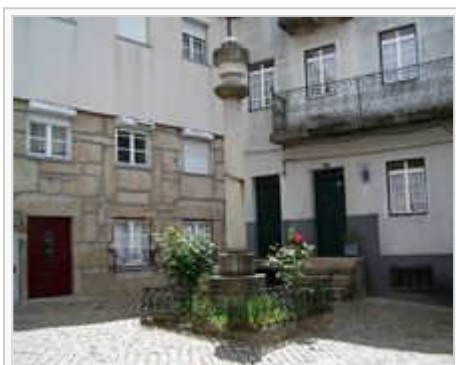
Largo do Pelourinho

Loriga tinha a categoria de sede de concelho desde o século XII, tendo recebido forais em 1136 (João Rhânia, senhorio das Terras de Loriga durante cerca de duas décadas, no reinado de D.Afonso Henriques), 1249 (D.Afonso III), 1474 (D.Afonso V) e 1514 (D.Manuel I). Apoiou os Absolutistas contra os Liberais na guerra civil portuguesa. Deixou de ser sede de concelho em 1855 após a aplicação do plano de ordenação territorial levada a cabo durante o século XIX, curiosamente o mesmo plano que deu origem aos Distritos. Porém, partir da primeira metade do século XIX, tornou-se um dos principais pólos industriais da Beira Alta, com a implantação da indústria dos lanifícios, que entrou em