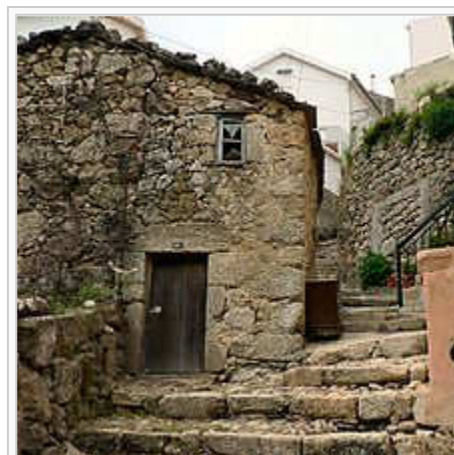
Rua da Oliveira

O bairro de São Ginês é um bairro do centro histórico de Loriga cujas características o tornam num dos bairros mais típicos da vila. As melhores festas de São João eram feitas aqui. Curioso é o facto de este bairro dever o nome a São Gens, um santo de origem céltica matirizado em Arles, na Gália, no tempo do imperador Diocleciano, orago de uma ermida visigótica situada na área. Com o passar dos séculos os loriguenses mudaram o nome do santo para S. Ginês, talvez por ser mais fácil de pronunciar. Este núcleo da povoação, que já esteve separado do principal e mais antigo, situado mais abaixo, é anterior à chegada dos romanos.