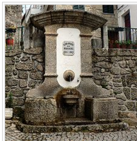
Fontanário em Loriga