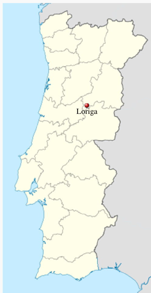
Localização de Loriga em Portugal

Fundada originalmente no alto de uma colina entre ribeiras onde hoje existe o centro histórico da vila. O local foi escolhido há mais de dois mil e seiscentos anos devido à facilidade de defesa (uma colina entre